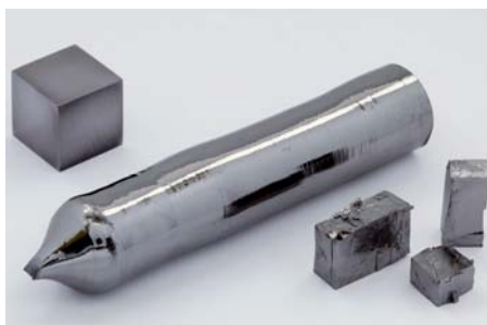
Een enkelkristal tantaal met daarnaast een kubus tantaal van 1 cm 3 . De oxidehuid is uitzonderlijk resistent

Dit artikel is geschreven door N.W. (Ko) Buijs van Innomet. Voor de levering van metalen als Ti, Zr, Ta, Nb, W, Ni, en Mo is Innomet een samenwerking aangegaan met het Chinese bedrijf Xi'an Refractory & Precise Metals Co. Ltd. Meer informatie via www.innomet.nl en www.refractorymetals.cn .