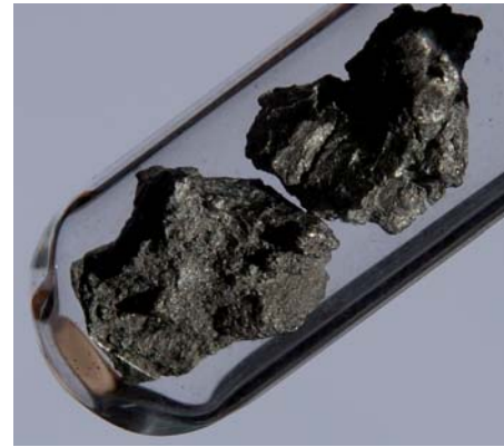
Stukjes zirkoon met een massa van 2,5 g en ongeveer 1 cm groot. Zirkoon is een hart met een grijszilver uiterlijk

Dankzij het hoge atoomnummer is het geschikt als anodemateriaal in een röntgenbuis. Vanwege het zeer hoge smeltpunt wordt wolfram gebruikt als gloeidraad in de bekende gloeilamp-