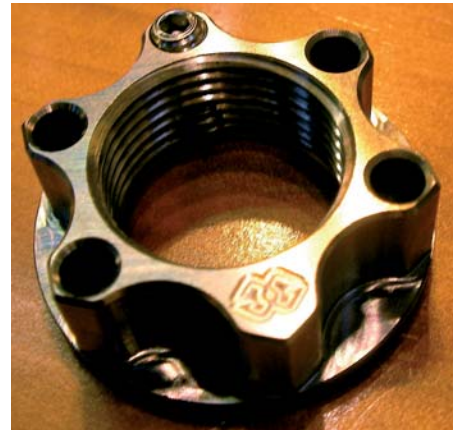
Een titaan-moer voor de achteras van een motorfiets van de legering Ti6AlV4, met een eigen massa van maar 20 g. Dit onderdeel wordt op het internet aangeboden met een prijs van 50 pond sterling