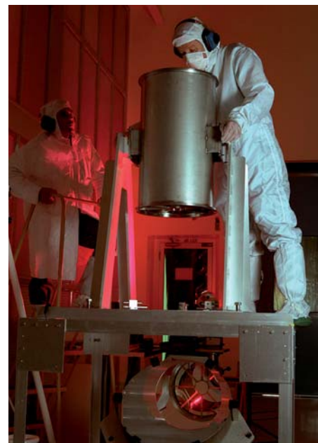
Een prototype van een nikkelen spiegel. In de ongelegeerde conditie is nikkel goed toe te passen in procesapparatuur