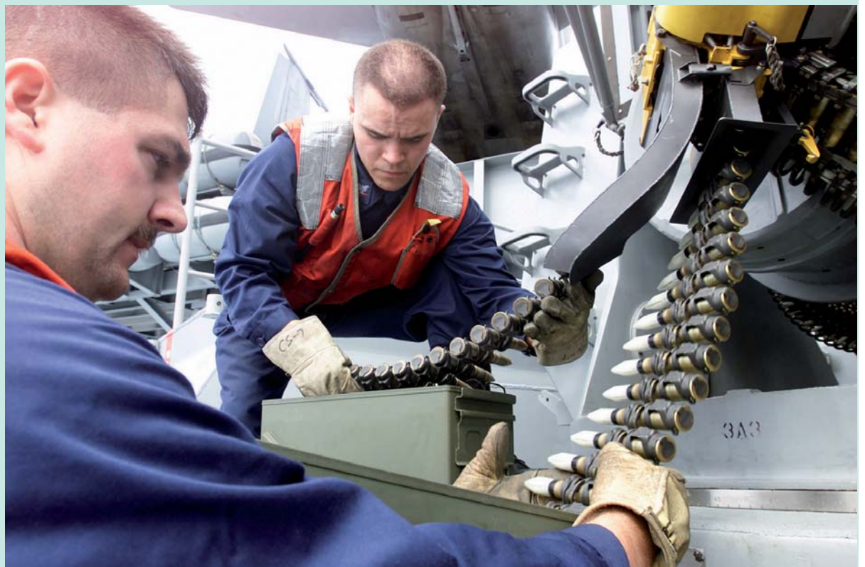
Eén toepassing van wolfram is als pantsermateriaal en omhulsels van kogels en granaten omdat de hardheid bij hogere temperatuur behouden blijft

Onderstaand een opsomming van diverse 'exoten' die in de metaal toch meer worden gebruikt dan men veelal aanneemt. In deze summier opgave enige relevante kenmerken en vooral toepassingsgebieden.