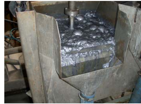
Een opname gemaakt van de bereiding van molybdeen. Dit metaal verhoogt de mechanische waarden van staal

Molybdeen is een metaal met een hoog smeltpunt en een dichtheid van 10.200 kg/m 3 . Het meeste van al het wereldwijd geproduceerde