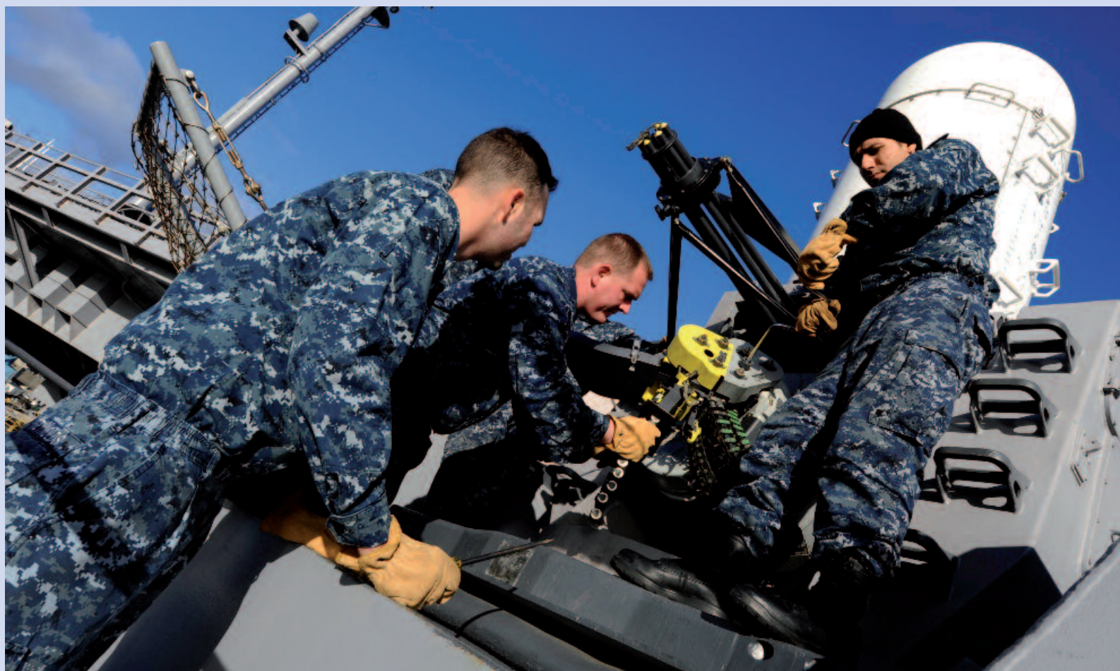
Het laden van 20 mm patronen in een Phalanx wapensysteem aan boord van het Amerikaanse vliegdekschip USS John C. Stennis. Wolfram wordt hier ingezet vanwege de hardheid

Ook in staal zal een geringe hoeveelheid wolfram de hardheid sterk laten toenemen.