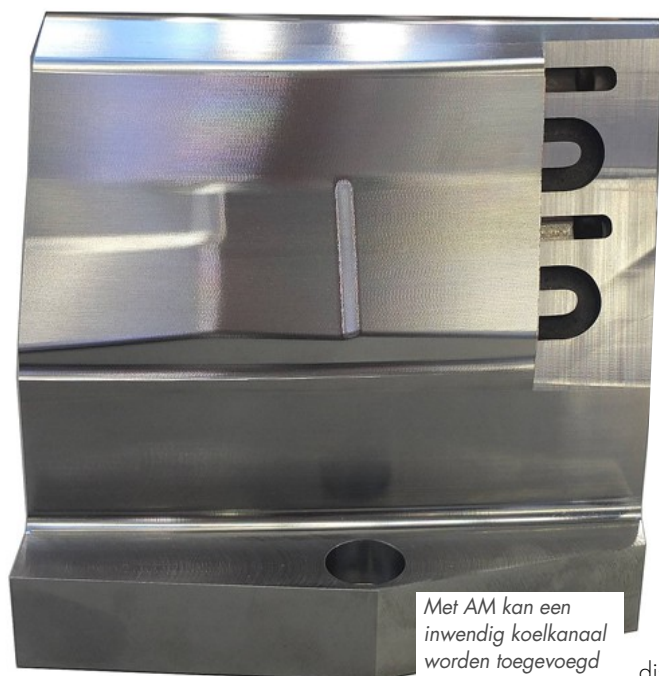
Met AM kan een inwendig koelkanaal worden toegevoegd

ADDITIVE MANUFACTURING WERKT RESHORING IN DE HAND